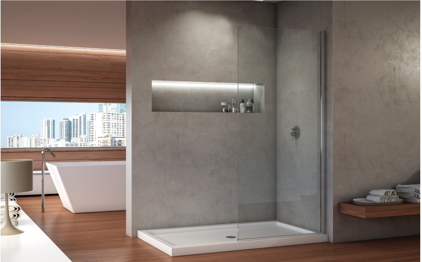
Model shown / Modèle présenté : VSXS30-11-40-79