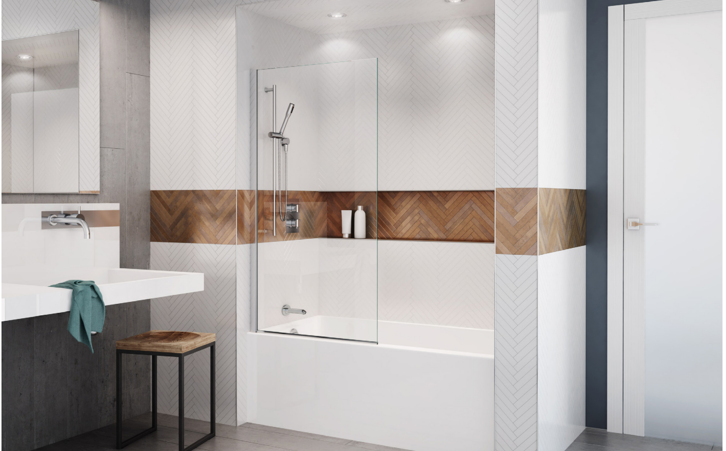
Model shown / Modèle présenté : VSXT30-11-40L